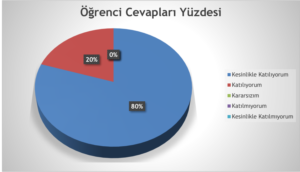
Şekil 3: Öğrencilerin Öğretmenlerine Ulaşabilirlik Düzeyi