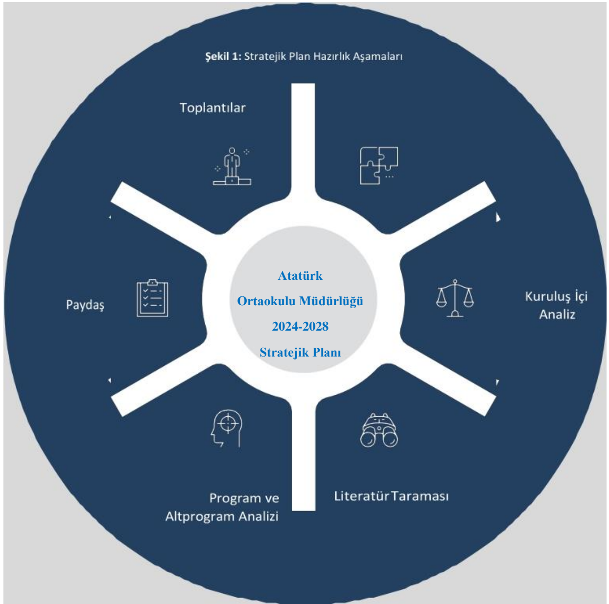
Şekil 1: Stratejik Plan Hazırlık Aşamaları

çerçevesinde geleceğe ilişkin misyon ve vizyonlarını oluşturmak, stratejik amaçlar ve ölçülebilir hedefler saptamak, performanslarını önceden belirlenmiş olan göstergeler doğrultusunda ölçmek ve bu sürecin izleme ve değerlendirmesini yapmak amacıyla katılımcı yöntemlerle stratejik plan hazırlamaktadır.