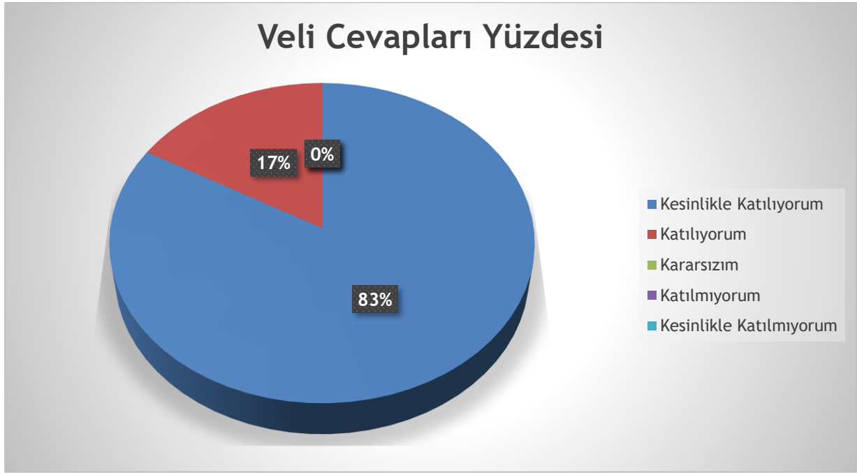
Şekil 4: Velilerin Memnuniyet Seviyesi

Okulumuzda öğrenim gören öğrencilerin velilerine yönelik gerçekleştirilmiş olan anket çalışması sonuçları aşağıdaki gibidir.