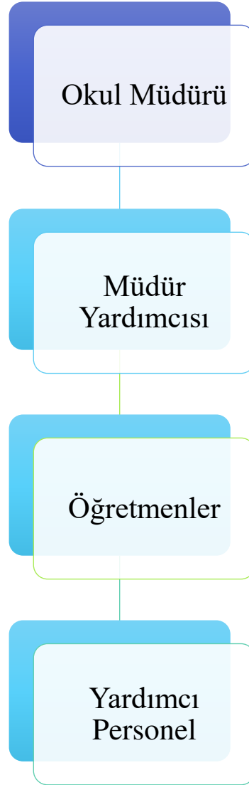
Şekil 5: Atatürk Ortaokulu Teşkilat Şeması

Okul/kurumun teşkilat şeması, şubeler, bölümler, birimler, atölye/işlik durumu, sınıflar vb. ortaya konulur. Bu birimler arasında iletişimin (haberleşme, bilgi alış-verişi) nasıl sağlandığı belirtilir.